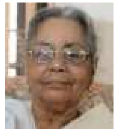
ലോസ്ആഞ്ചലസ്: പന്ത്രണ്ടുപുഴിക്കാട് ചിക്കൻപറായിൽ