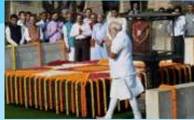
മഹാത്മാവിന് രാഷ്ട്രത്തിന്റെ ആദരവ്... ഫയൽചിത്രം

“ഈ ഭൂമുഖത്ത് ഇമ്മാതിരിയൊരു മനുഷ്യൻ രക്തമാംസങ്ങളോടെ ജീവിച്ചിരുന്നു എന്ന് വിശ്വസിക്കാൻ വരുതലമുറകൾ തയ്യാറായില്ല എന്നു വരാം.” ആൽബർട്ട് ഐൻസ്റ്റൈൻ