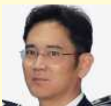
സിയൂൾ: അഴിമതിക്കേസിൽ സാംസംഗ് ഗ്രൂപ്പ് മേധാവിയെ

ലീ ജേ യാംഗിന് അഞ്ചുവർഷം തടവ്. സിയൂൾ ഡിസ്ട്രിക്ട് കോടതിയാണു ശിക്ഷ വിധിച്ചത്. സാംസംഗിന്റെ രണ്ടു യൂണിറ്റുകളുടെ ലയനത്തിന് അനുമതി കിട്ടാനായി പ്രസിഡന്റ് പാർക്ക് ഗ്യൂൻഹെയുടെ സഹായി ചോയി സുൺ സിലിന്റെ കമ്പനിയിലേക്കു വൻതുക ലീ ഒഴുക്കിയെന്നാണ് കേസ്. ഈ പ്രശ്നത്തിൽ