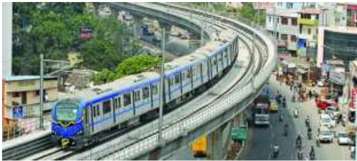
പ്രവർത്തനം ആരംഭിച്ച ചെന്നൈ മെട്രോ

ബെയിൽ ജനങ്ങൾ വീടുനിർമ്മിക്കാനായി മതിലിൽ നിന്ന് അടർത്തിയെടുക്കുന്ന കല്ലും മൺകട്ടകളുമാണ് ഉപയോഗിക്കുന്നത്. മതിലിനുമുകളിൽ പാകിയിരുന്ന കൊത്തുപണികളോടുകൂടിയ കൽഫലകങ്ങൾ 30 യുവാർ വിലയ്ക്കാണ് വിപണിയിൽ വിൽപ്പന നടക്കുന്നത്. ചൈനീസ് നിയമമനുസരിച്ച് 5000 യുവാറാണ് മതിലിന്റെ ഭാഗങ്ങൾ നശിപ്പിക്കുന്നവർക്കു ലഭിക്കുന്ന പിഴ. ടൂറിസ്റ്റുകൾ വൻതോതിൽ എത്തുന്നത് വൻമതിൽ സംരക്ഷണത്തിനു തടസമാകുന്നതായി ഗ്ലോബൽ ടൈംസ് റിപ്പോർട്ടു ചെയ്തു.