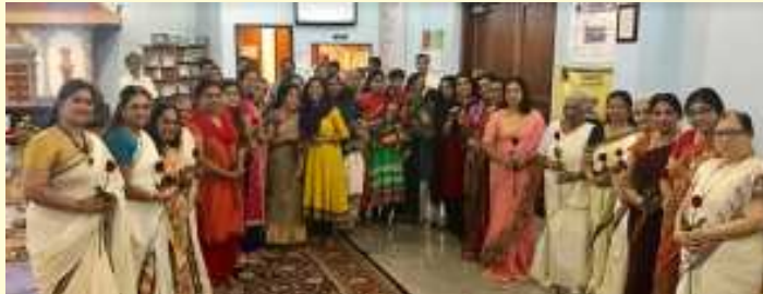
ഡാളൻ ശ്രീ ഗുരുവായൂരപ്പൻ ക്ഷേത്രത്തിൽ നടന്ന മാതൃദിനാഘോഷം

ഷിക്കാഗോ: മെക് ഡോണാൾഡ് ജീവനക്കാരുടെ കുറഞ്ഞ വേതന നിരക്ക് വർദ്ധിപ്പിക്കണമെന്ന് ആവശ്യപ്പെട്ട് ചിക്കാഗോ ഡോണാൾഡ് ജീവനക്കാർ കുറ്റൻ പ്രകടനം നടത്തി. യുണൈറ്റഡ് കോന്റീനന്റൽ ഹോട്ടലിൽ ചെയർ ഹോൾ ഡോണാൾഡ് ജീവനക്കാരുടെ ആവശ്യം ഇപ്പോൾ 7.5 ഡോളറാണ് മിനിമം വേതനമായി ലഭിക്കുന്നത്. മെക് ഡോണാൾഡ് സ്വന്തമായി നടത്തുന്ന റെസ്റ്റോറന്റുകളിൽ 10 ഡോളർ ലഭിക്കുമ്പോൾ ചില സ്ഥലങ്ങളിൽ പത്തു ഡോളറിൽ താഴെയാണ് നൽകുന്നത്. നവംബറിൽ നടന്ന തിരഞ്ഞെടുപ്പിൽ മിനിമം വേതനം ഉയർത്തുമെന്ന് റിപ്പബ്ലിക് പാർട്ടി വാഗ്ദാനം നൽകിയിരുന്നതായും പ്രകടനക്കാർ ചൂണ്ടിക്കാട്ടി. ചെയർ ഹോൾഡേഴ്സിന്റെ യോഗത്തിൽ ചോദ്യോത്തര വേളയിൽ ഈ വിഷയം ഉന്നയിച്ചുള്ള ചോദ്യങ്ങൾ ഒന്നും തന്നെ ഉയർന്നില്ലെന്ന് കമ്പനി വക്താക്കൾ അറിയിച്ചു. രാജ്യവ്യാപകമായി പതിനായിരക്കണക്കിന് ജീവനക്കാരുടെ കുറഞ്ഞ വേതനം ഉയർത്തണമെന്ന് ആവശ്യപ്പെട്ട് രംഗത്തെത്തിയിരിക്കുന്നത്.