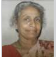
ടൊറന്റോ: തൃശൂർ ആലപ്പുഴ പള്ളിപ്പുറത്തുകാരൻ ദേവ