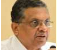
തിരുവനന്തപുരം: കൊച്ചി മെട്രോയുടെ സുരക്ഷാവിഭാഗം ഉപദേഷ്ടാവായി മുൻ