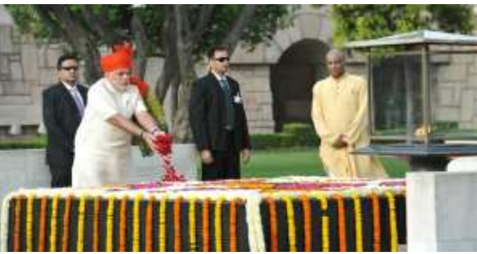
രാഷ്ട്രപിതാവിന് രാഷ്ട്രത്തിന്റെ ആദരാഞ്ജലി

10ന് ബർലിൻ മതിൽ പൊളിച്ചുതീക്കാൻ ഇദ്ദേഹം മുൻപന്തിയിലുണ്ടായിരുന്നു. ജനഹിതത്തിനനുസരിച്ചുള്ള പല നല്ലകാര്യങ്ങൾക്കും വൈസേക്കർ അന്നത്തെ ചാൻസലറായിരുന്ന ഹെൽമൂട്ട് കോൾ മന്ത്രിസഭയ്ക്ക് ഉപദേശം നൽകിയിരുന്നത് സ്മരണയെന്നു കാണമായി.