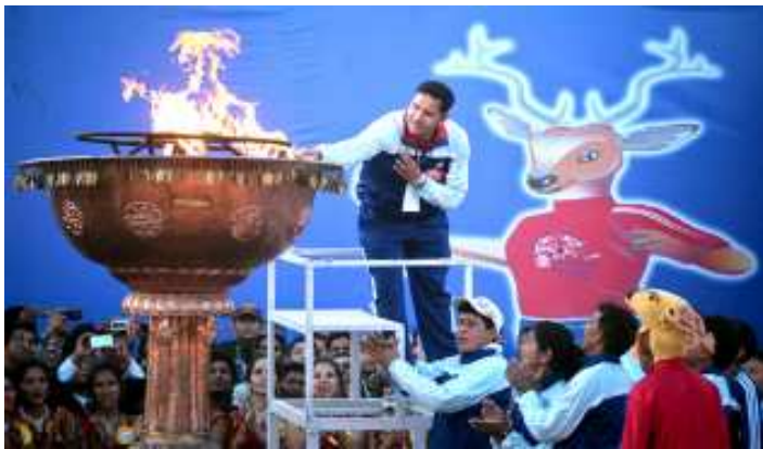
ദേശീയ ഗെയിംസിന്റെ തുടക്കം കുറിച്ചുകൊണ്ട് ക്രിക്കറ്റ് ഇതിഹാസം സച്ചിൻ തെണ്ടുൽക്കർ ദീപം തെളിയിച്ച് ഉദ്ഘാടനം ചെയ്യുന്നു

'മതത്തിന്റെ പേരിലുള്ള അന്ധവിശ്വാസം അവസാനിപ്പിച്ചാൽ മാത്രമേ ഇന്ത്യയ്ക്കു പുരോഗതി കൈവരിക്കുവാൻ കഴിയുകയുള്ളൂവെന്നതായിരുന്നു ബരാക് ഒബാമയുടെ പ്രസംഗത്തിന്റെ ചുരുക്കം. 'തിരഞ്ഞെടുക്കുന്ന വിശ്വാസം അനുഷ്ഠിക്കാൻ ഏതു വ്യക്തിക്കും അവകാശമുണ്ട്. ലോകത്തിൽ നാം അനേകിക്കുന്ന സമാധാനം തുടങ്ങുന്നത് മനുഷ്യഹൃദയങ്ങളിലാണ്.' ഇന്ത്യൻ ഭരണഘടനയിൽ നിന്നും മതേതരത്വവും സോഷ്യലിസവും എടുത്തു മാറ്റണമെന്നതാണ് അതിലൊന്ന്. അതുണ്ടാക്കുന്ന സാമൂഹ്യപ്രശ്നങ്ങളാണ് ഇന്ത്യൻ വളർച്ചയ്ക്കുണ്ടാകുന്ന പ്രധാന തടസ്സമെന്നാണ് ഒബാമയുടെ പ്രസംഗത്തിന്റെ ഉള്ളറവു നൽകുന്ന പാഠം. മഹാത്മജിയുടെ 67-ാം രക്തസാക്ഷിദിനം നൽകുന്ന സന്ദേശമായിരിക്കട്ടെ ഭാരതത്തിന്റെ ഭാവസന്ദേശം.